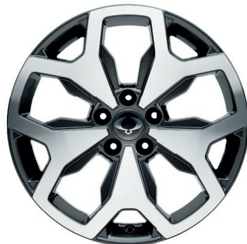
18" ALU kola "Diamond Cut", pneumatiky 235/55 R18