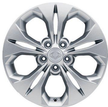
17" ALU kola, pneumatiky 225/60 R17