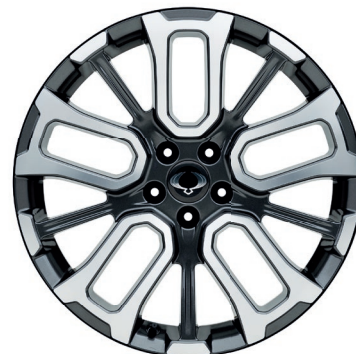
20" ALU kola "Diamond Cut", pneumatiky 245/45R R20